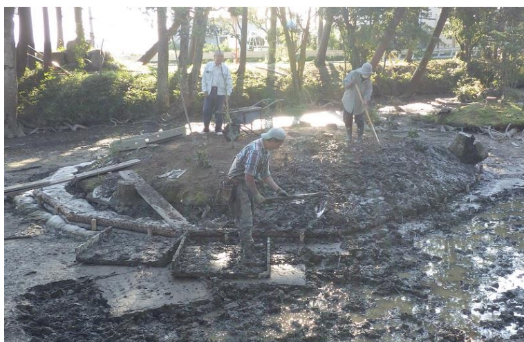
↑ 人力による盛土の作業